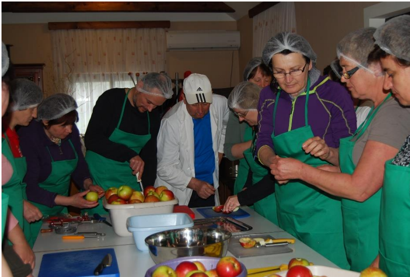
NPK Predelovalec sadja na tradicionalen način