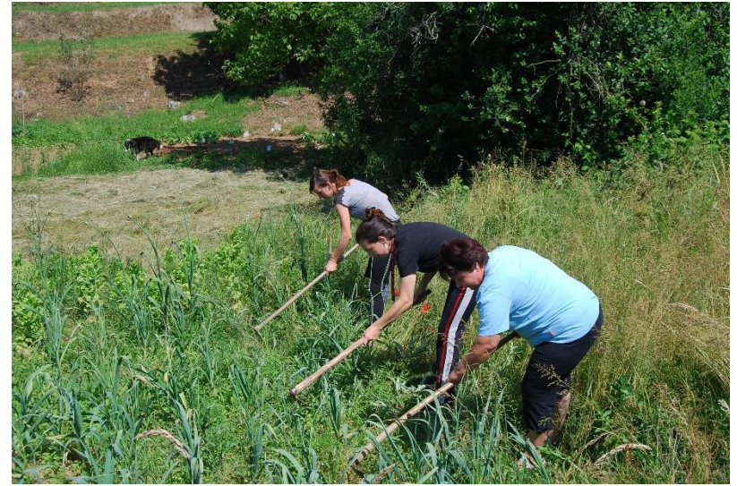
NPK Ekološki kmetovalec