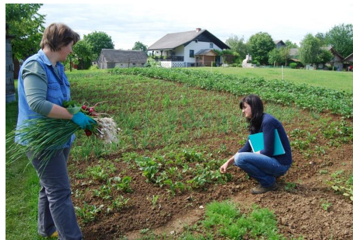
Zelenjadar, vrednotenje znanj