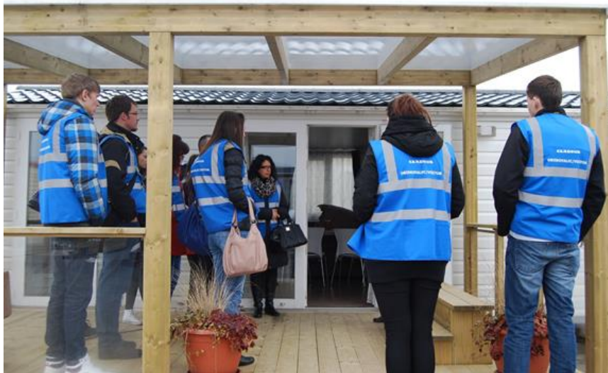
Brezposelni, projekt Pokolpje