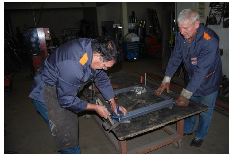
Varilec, poklicne kompetence