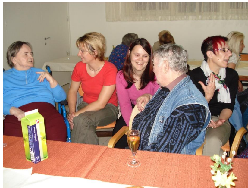
Družabnik za starejše osebe