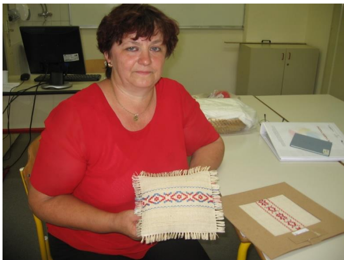
Vezilja, kulturna dediščina