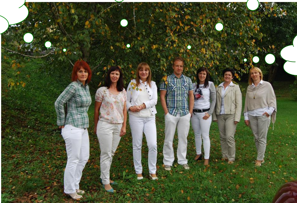
Zaposleni ZIK Črnomelj