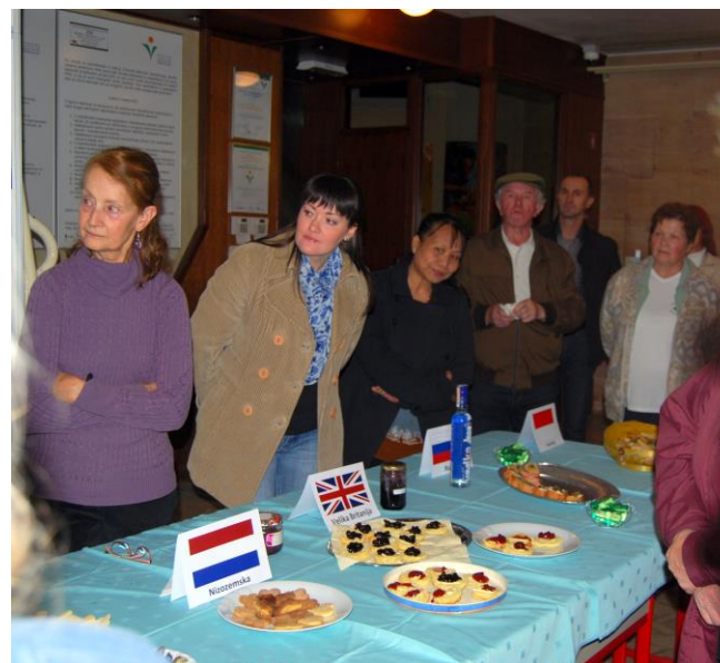
Priseljenci in medkulturni dialog