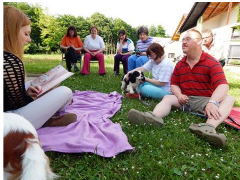
Udeleženci s posebnimi potrebami