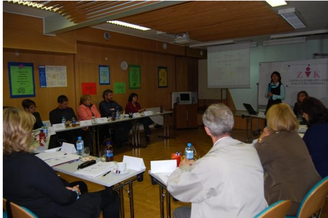
Fokusna skupina na temo razvoja novih programov