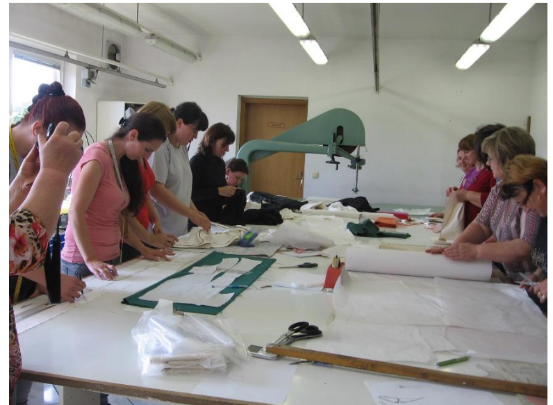
Oblikovalka tekstilnih izdelkov