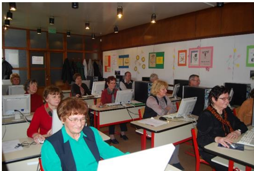
Starejši odrasli, razvoj digitalne kompetence